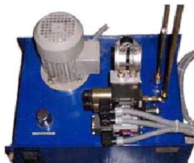
VYSOKOTLAKOVÝ AGREGÁT REGULACE

Regulační ventil (RURV) Točivé redukce ve spojení s vysokotlakovým elektrohydraulickým systémem má oproti nízkotlakovému regulačnímu systému (který se používá u parních turbín) nespornou výhodu v jednoduchosti. Odpadají mechanické převody (páky) a složitý olejový servopohon, který je nahrazen jednoduchým sériově vyráběným hydraulickým válcem. Z obrázku je zřejmá mechanická jednoduchost vysokotlakového systému, ze které vyplývá také přesnost a spolehlivost, poněvadž u RURV nejsou použity spojky ani klouby a tím odpadají nutné montážní vůle, které mají vliv jak na přesnost, tak na životnost.